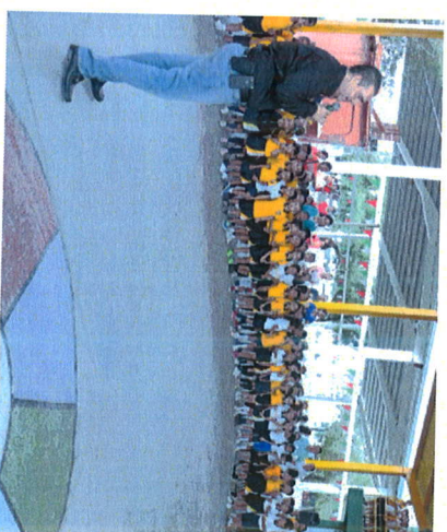
El municipio dialogó con los alumnos sobre las oportunidades de estudio.