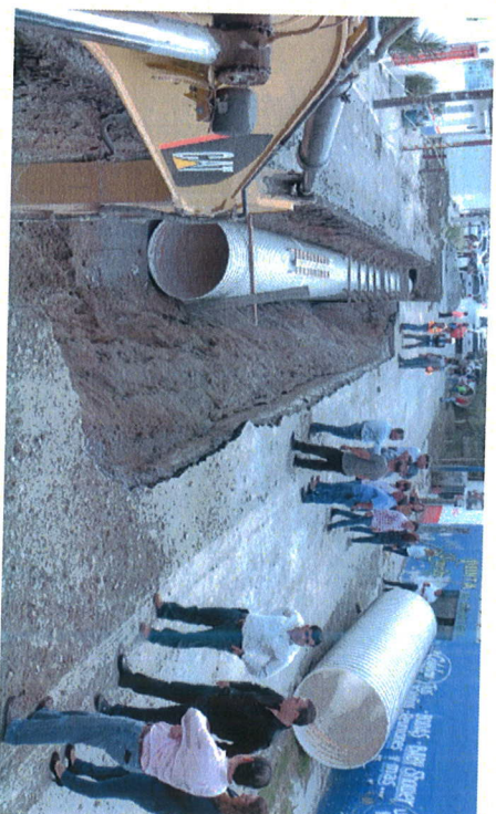
La obra se realiza en la colonia Garza Ayala, con una inversión de 35 millones de pesos.

“Es una obra que estaba esperando la gente por décadas una obra que es de suma importancia para todo lo que es el centro de nuestro municipio, la Colonia Garza y Garza, y hoy con esta obra le vamos a dar ya la solución ustedes están viendo los trabajos que se están realizando de canalización de este drenaje pluvial, es una inversión